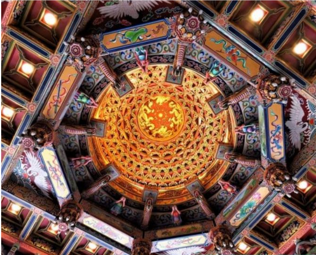
台南南鯤鯓代天府藻井