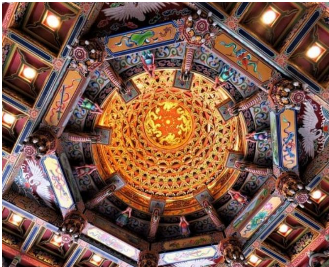
台南南鯤鯓代天府藻井