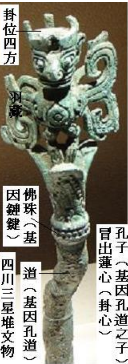
孔子(基因孔道之子) 冒出蓮心(卦心)